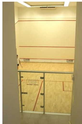
Court de droite