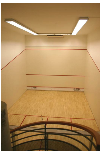
Court de gauche

Le Square compte actuellement plus de 300 joueurs réguliers, un chiffre plutôt encourageant !