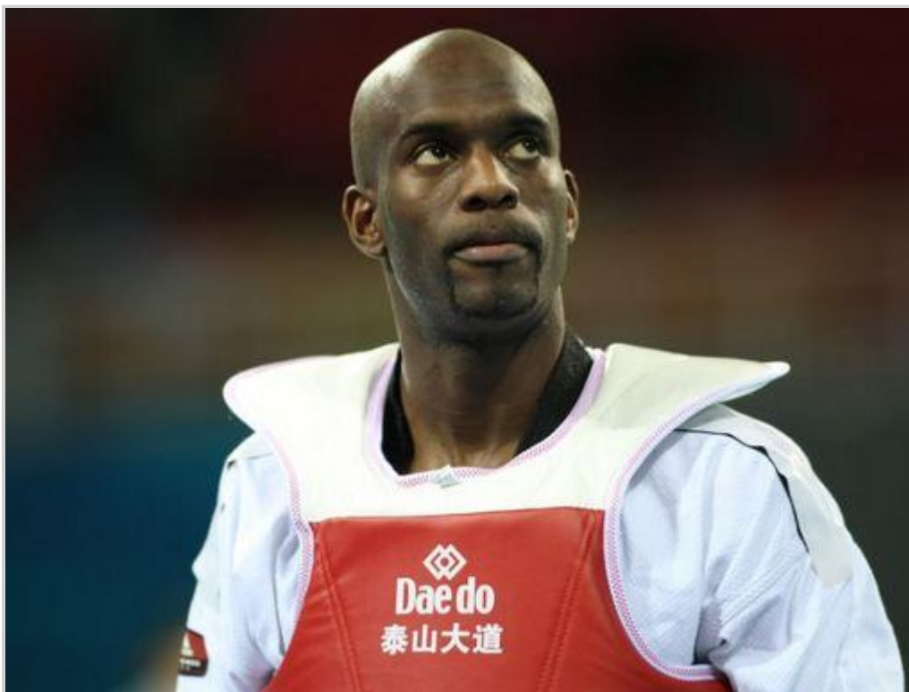
Pascal Gentil, le champion français de taekwondo