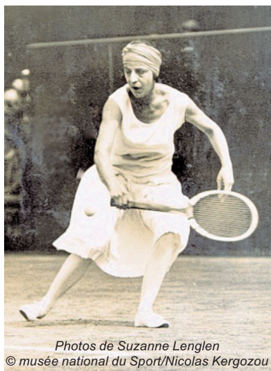
Photos de Suzanne Lenglen

Le costume qu'elles affichent lors de ces rencontres sportives, et qui s'inspire largement du vestiaire masculin, réveille à l'époque de vieux démons, en particulier la crainte d'une "civilisation sans sexes" ou pire, d'un renversement de la société patriarcale. Comme à la fin du siècle précédent, l'indifférenciation vestimentaire avec les hommes est synonyme de "masculinisation" et suscite toujours autant de doutes et d'inquiétude, quelles que soient leurs performances. Nous sommes loin des discours élogieux dont bénéficient notamment les joueuses de tennis, à l'image de la championne Suzanne Lenglen (la meilleure joueuse mondiale du moment) dont l'élégance des robes, comme les audaces vestimentaires, lui valent autant de louanges que ses performances.