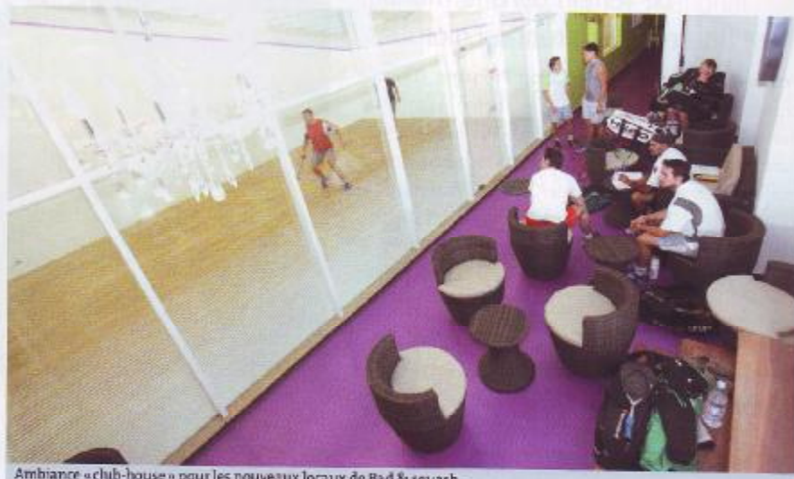
Ambiance « club-house » pour les nouveaux locaux de Bad & squash.

• pour 2 membres d'une même famille : 291€